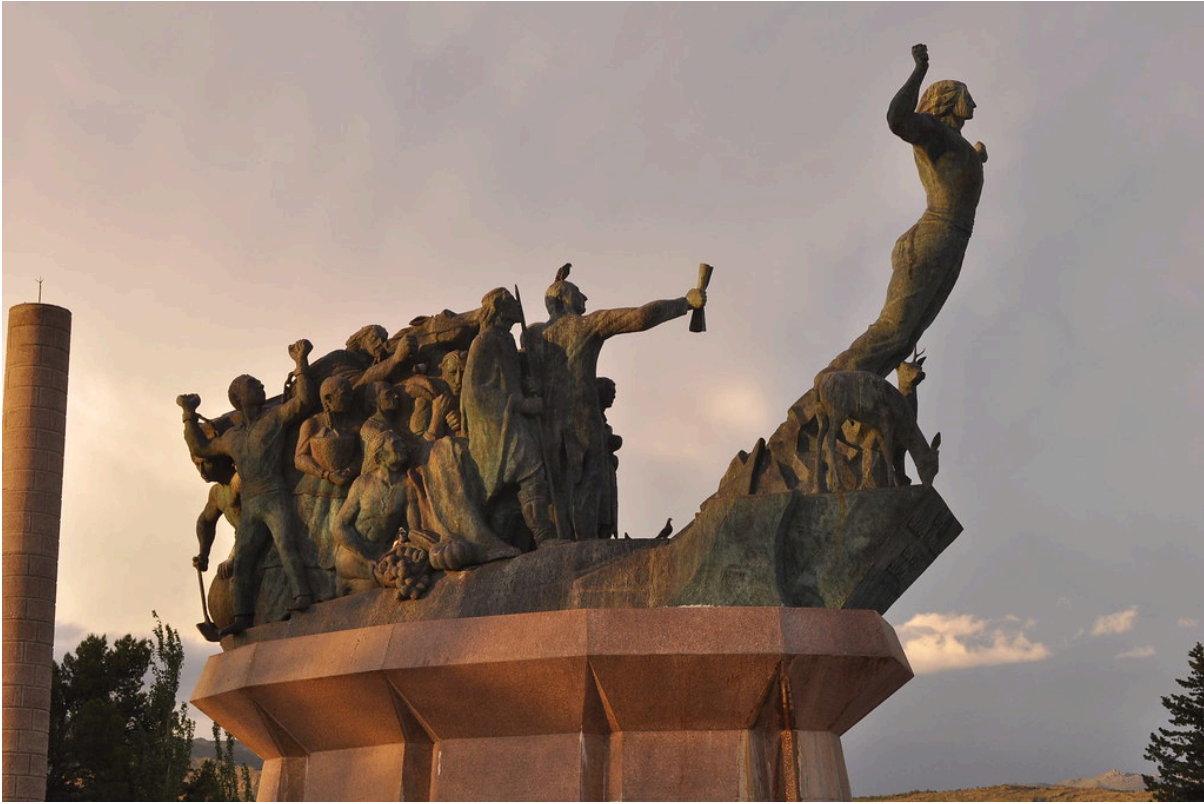
Monumento al pueblo puntano de la independencia - Julio César Domínguez

Ejemplos de escultura: Conjunto escultórico