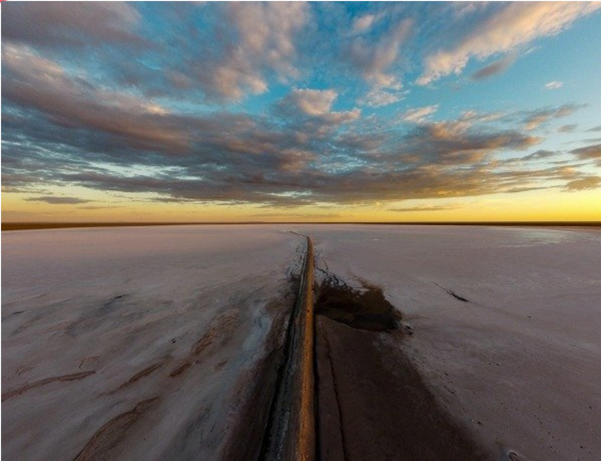
Planeta Salinas - Nicolás Varvara