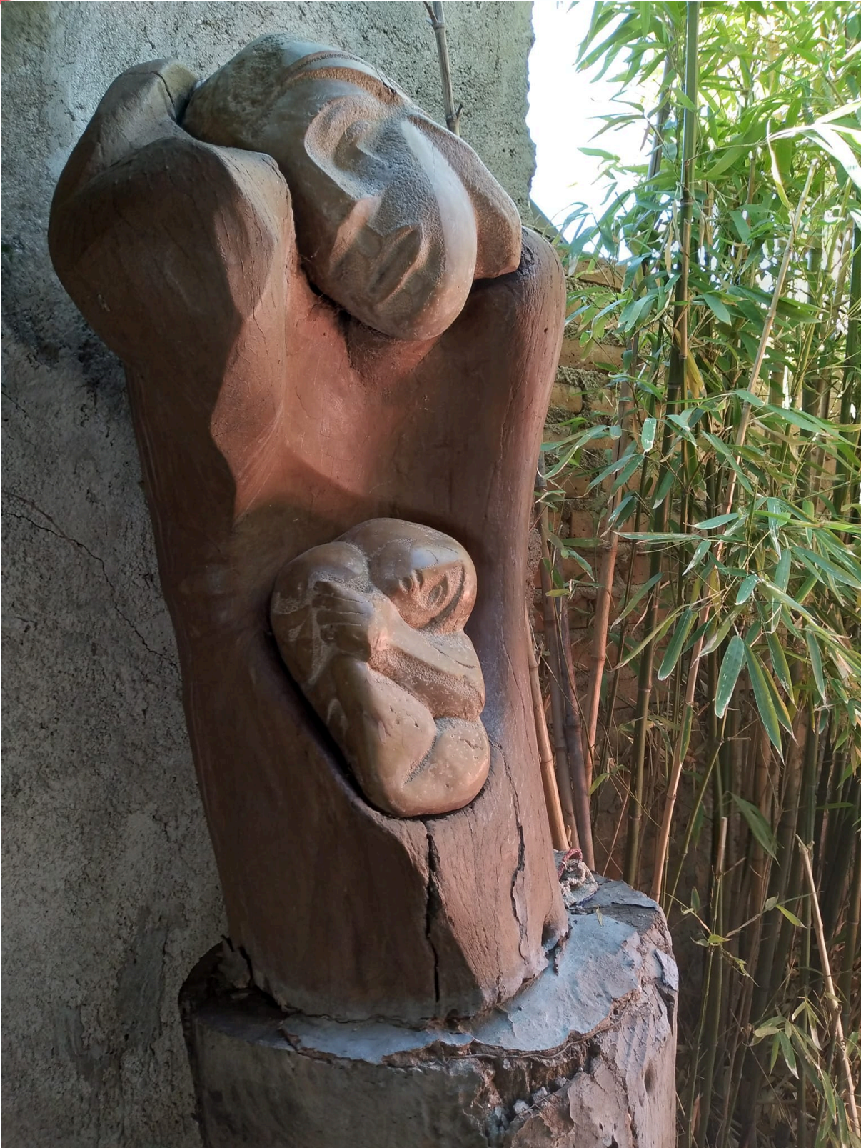
Obra de Carlos Cornejo