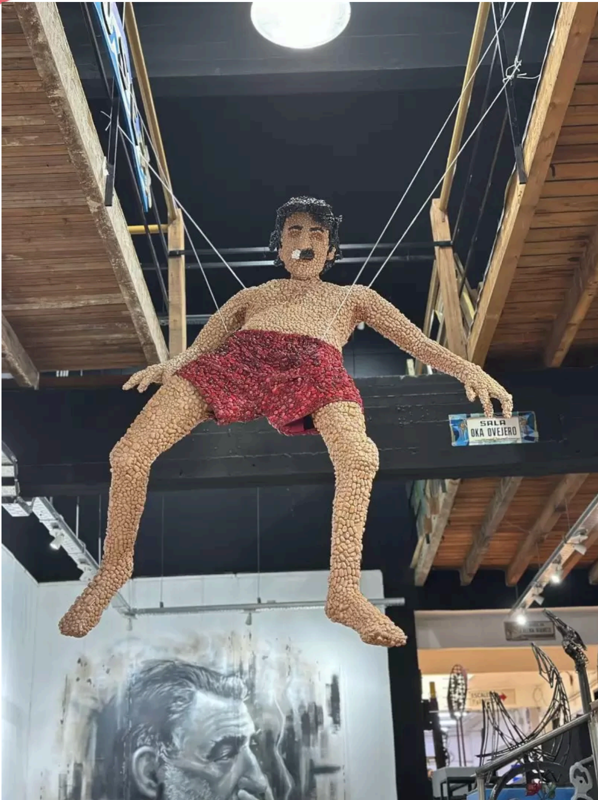
Clavadismo - Lamarencóche